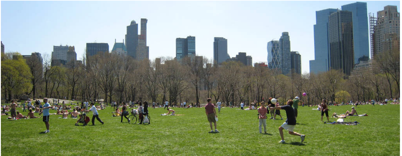
Sheep Meadow un domingo cualquiera

Al terminar en el Museo de Historia Natural, ir hasta la calle W72th, bien en metro, bien andando, que es donde está el edificio Dakota, donde vivía y fue asesinado John Lennon . Cruzando la calle y adentrándonos de nuevo en Central Park, está Strawberry Fields D , parte del parque homenaje a Lennon. Cruzamos Strawberry Fields, y seguimos bajando por el parque, y a la altura de la W66th, está Sheep Meadow E , para mi la vista más de bonita de Nueva York desde Central Park junto a la de la terraza del Met.