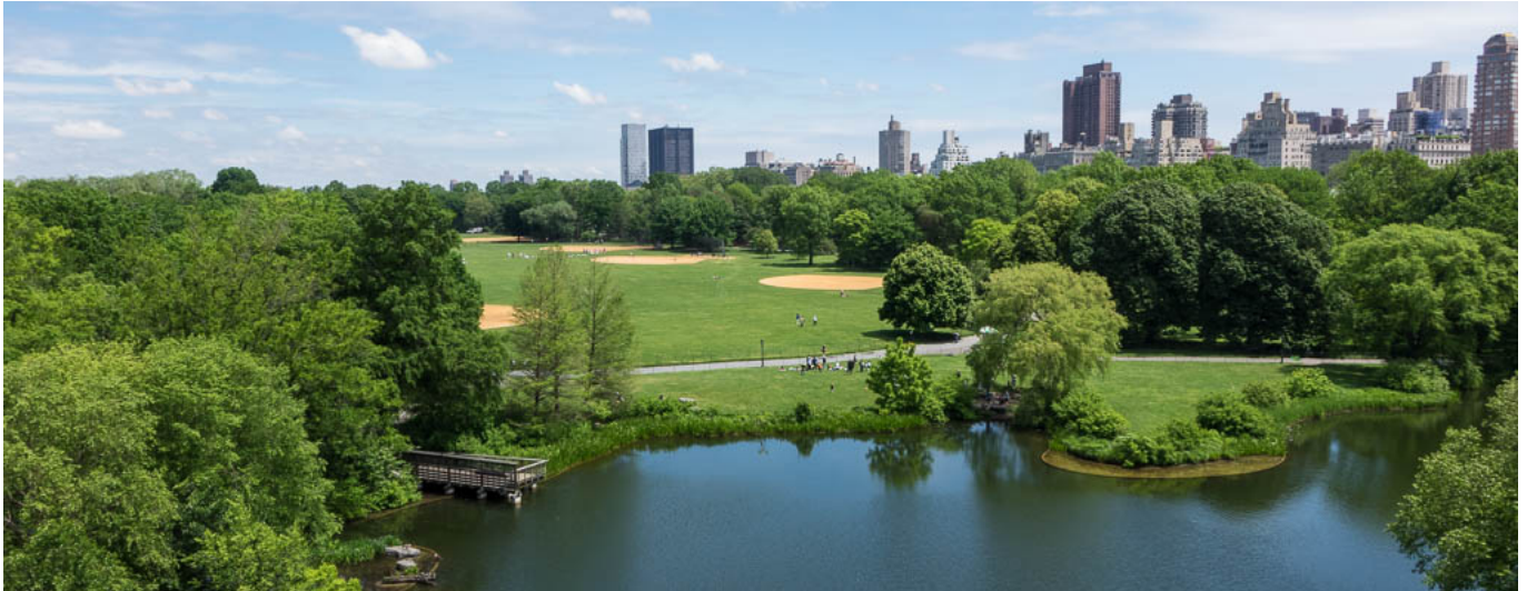
Great Lawn y Turtle Pond

Para aquellos que tengan más tiempo, o que quieran visitar the Great Lawn , donde es probable que veas a gente practicando béisbol, y el Delacorte Theatre, el camino más sencillo para llegar hasta allí es salir del Met hacia la izquierda y en la calle E84th comienza un camino peatonal que rodea al Met y va a dar justo al Great Lawn, para luego rodearlo por la izquierda para ir a ver Turtle Pond, un pequeño lago con una preciosa vista a Belvedere Castle, el Delacorte Theatre y salir de nuevo por el Shakespeare Garden a la calle W79th como en la anterior ruta.