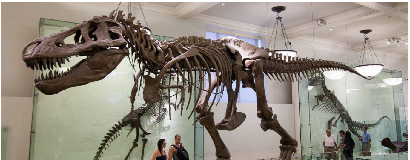
Interior del Museo Americano de Historia Natural